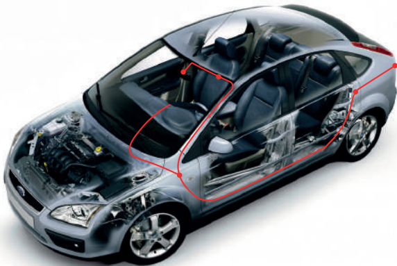
Рисунок ниже показывает пример подключения выносной камеры. Установите камеру в задней части салона автомобиля так, чтобы она не мешала Вам, и при этом был достаточный обзор для съёмки. Подключите камеру к разъёму на корпусе TrendVision DriveCam Signature.