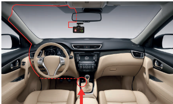
Автомобильная розетка (прикуриватель)

Пример установки кабеля питания, изображенный на картинке, рекомендован как наиболее безопасный, так как кабель не будет закрывать поле зрения водителя и отвлекать его от вождения.